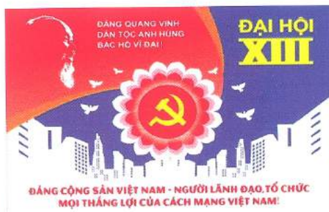
Hình 31b (panô tuyên truyền)