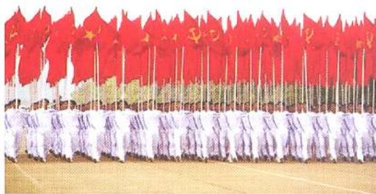
Hình 24b (rước theo hàng)