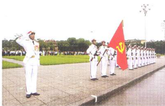
Hình 23b (giương cờ)