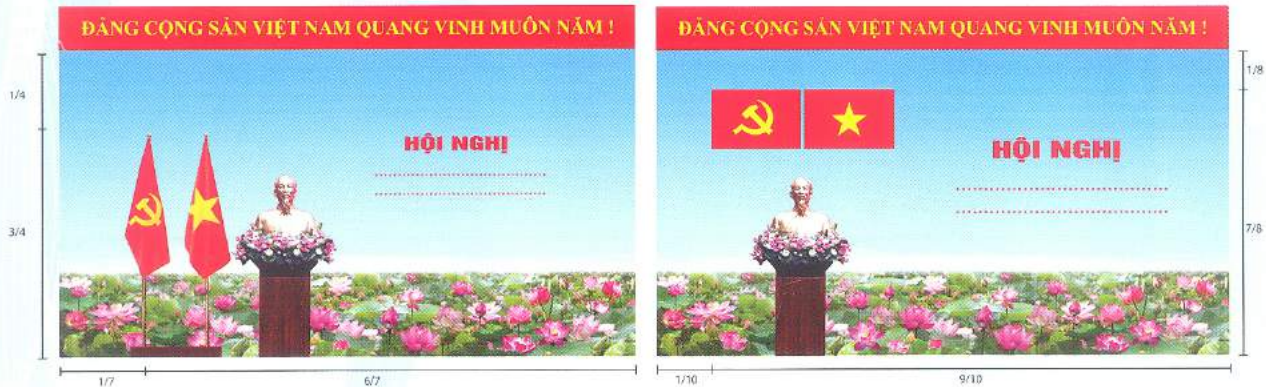
Hình 2 (Cờ có cán)