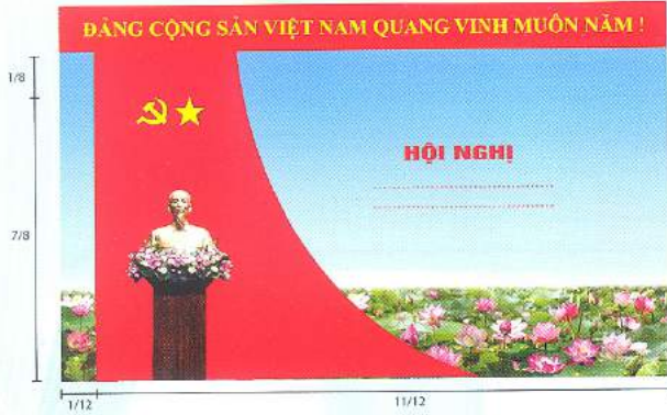
Hình 5b (cờ xếp chéo đơn)