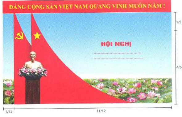
Hình 5c (cờ xếp chéo đôi)