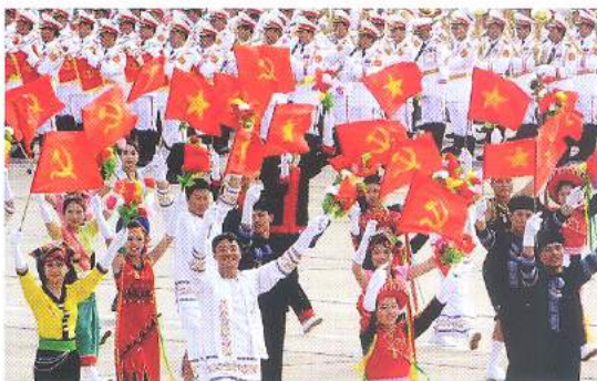
Hình 23d (vẫy bằng tay)