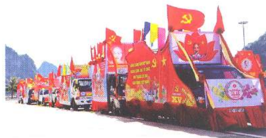
Hình 24d (rước bằng xe)